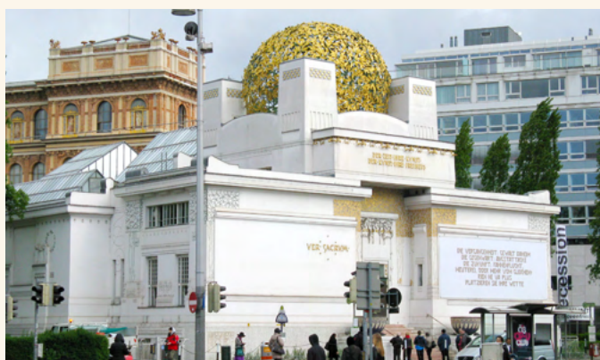
Wiener Secession, foto: Sophia Rasmussen