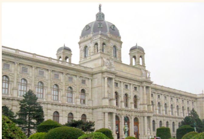
Kunsthistorisches Museum

Med Jönköpings läns konstförening i samarbete med KW KulturreSOR