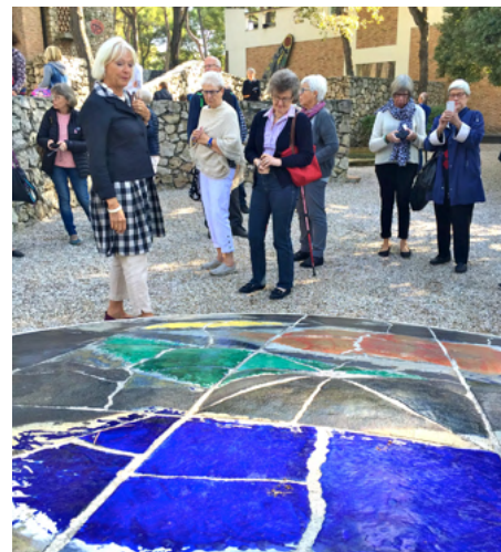
I museet Fondation Maeght i St. Paul finns verk av bl a Miró.

Vi lämnar havet och kör upp i bergen där rondeller och vägar blir smalare, krokigare med branta stup upp till Saint-Pauls med skulpturparken Fondation Maeght, ett franskt Louisiana. Vår vita buss parkerar i backen. Under gröna löv gör vi en kort promenad i uppforsbacke. På långt håll