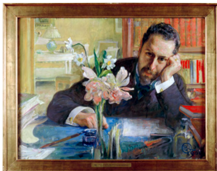
Carl Larsson, Porträtt av författaren Oscar Levvertin.