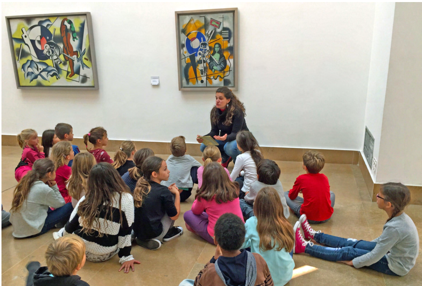
Konstpedagogiken spelar stor roll på franska museer. Skolbarn har fritt inträde. En skolklass får inspiration på Légermuseet.

Aktuella utställningar, bl.a. pågående Ungdomens vårsalong , visas.