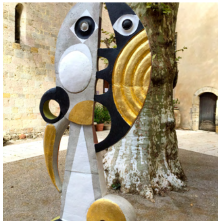
Skulptur vid entrén till Picassomuseet i Vallauris.