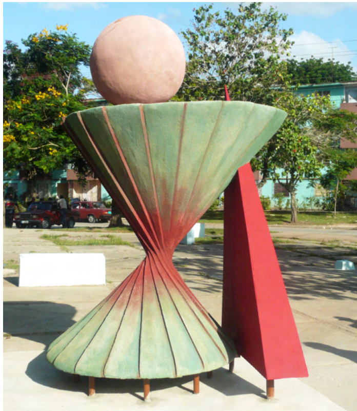
Skulpturen Andante finns på Kuba.