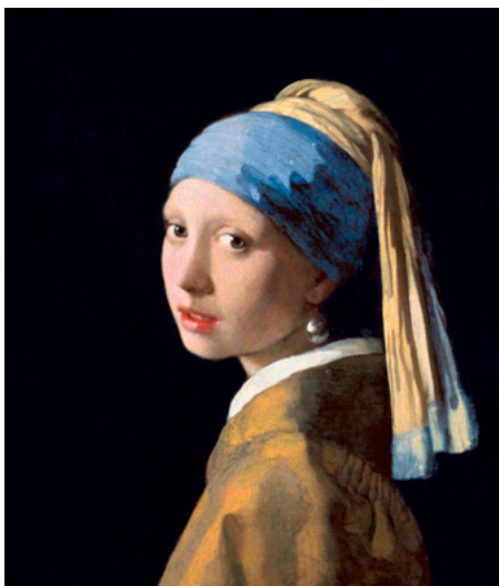
Flicka med turban (Flicka med pärlörhänge) 44,5 x 39 cm. Målningen finns på Mauritshuis i Haag. Romanen ”Flicka med pärlörhänge” är skriven av Tracy Chevalier.

Stämningen är varmt avvaktande. Ungdomlig skörhet kanske... nästan nära till gråt. En ung flicka på väg att bli kvinna. Hennes