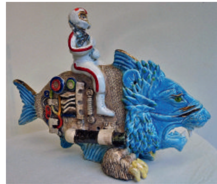
Leith Abbas, Lejonfisk, keramik

Lördag den 26 november, Jönköpings läns museum