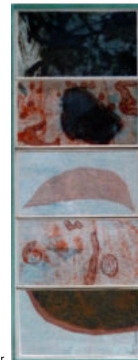
Anne de Geer, Under ytan. Inglasade grafiska etsningar