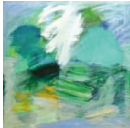
Douglas Wiberg, Abstrakt landskap, akryl