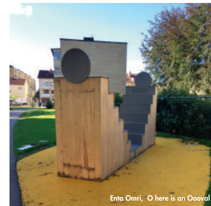
Enta Omri, O here is an Ooval