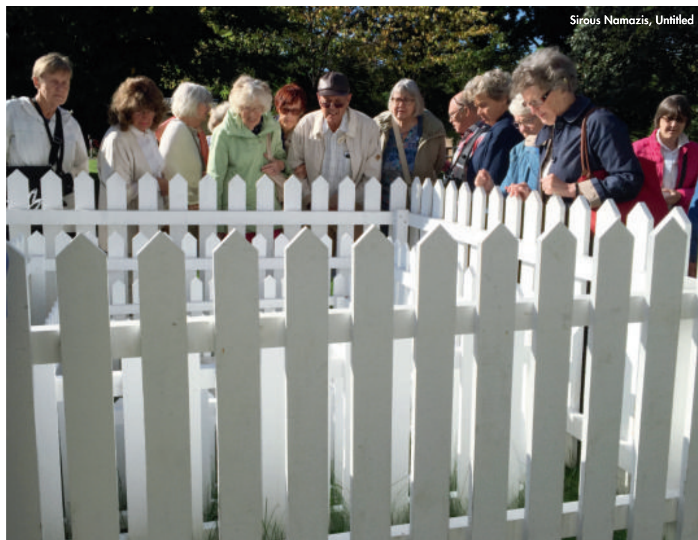
Sirous Namazis, Untitled