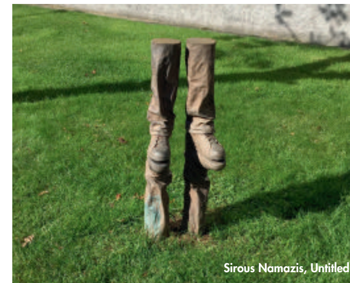
Sirous Namazis, Untitled