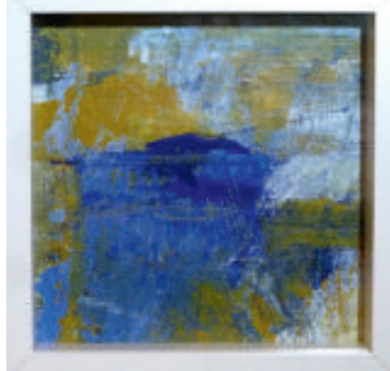
Roland Englund, Skenbart, akryl