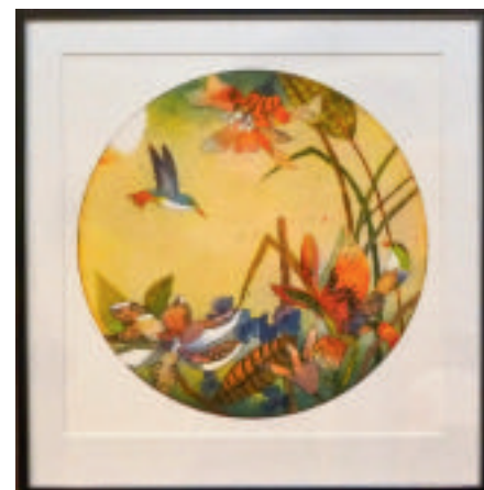
Jutta Votteler, Skymning, grafiskt blad