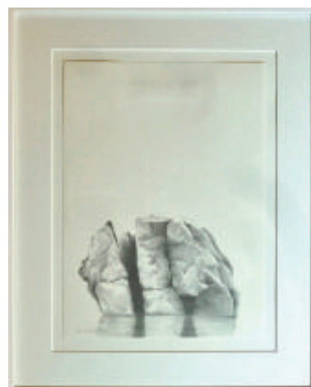
Bosse Blomén Svensson, Spegling II, blyerts