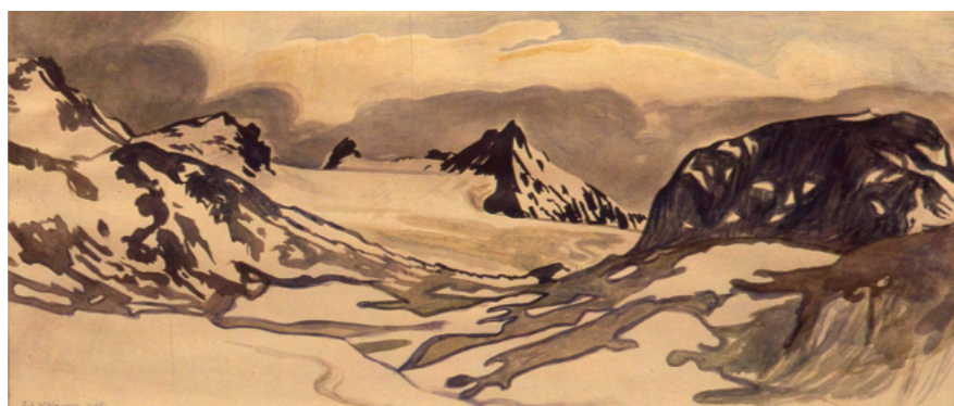
J.F. Willumsen, Jotunheimen, Akvarell 1895. Jönköpings läns konstförenings samling.