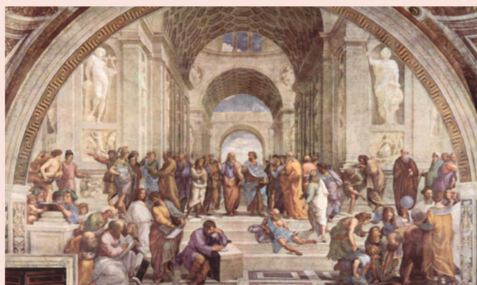
Skolan i Aten av Rafael finns i Apostoliska palatset, Vatikanstaten

Vi besöker konst- och kulturskatter i Rom, Umbrien och Toscana. Vi bor två nätter i Rom och tre nätter i Orvieto.