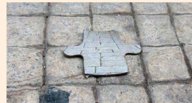
Magnus Thierfelder ställer ut i Nässjö konsthall