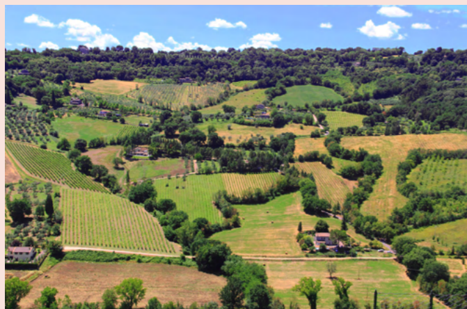
Utsikt från Orvieto