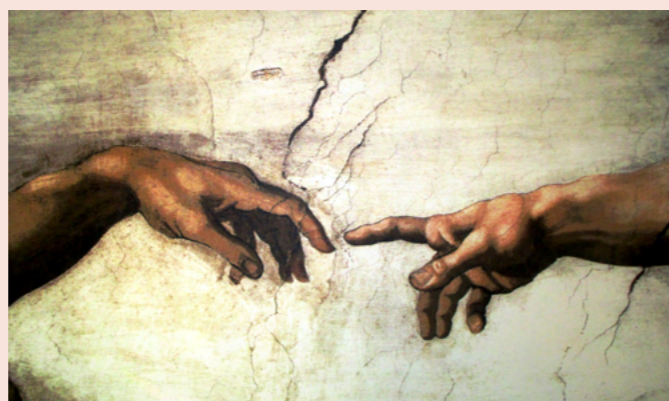
Detalj från Sixtinska kapellets tak, Michelangelo