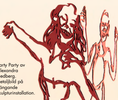
Party Party av Alexandra Hedberg. Detaljbild på hängande skulpturinstallation.

Skrattet representerar för Alexandra också det undflyende, det förgängliga, själva stunden, eftersom det äkta skrattet endast finns i ögonblicket.