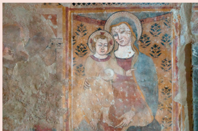
Fresk i San Francesco-kyrkan, Assisi