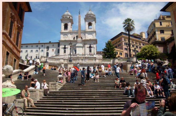
Spanska trappan, Rom