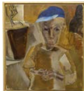
Vera Nilsson, Pojke med blå mössa , 1918