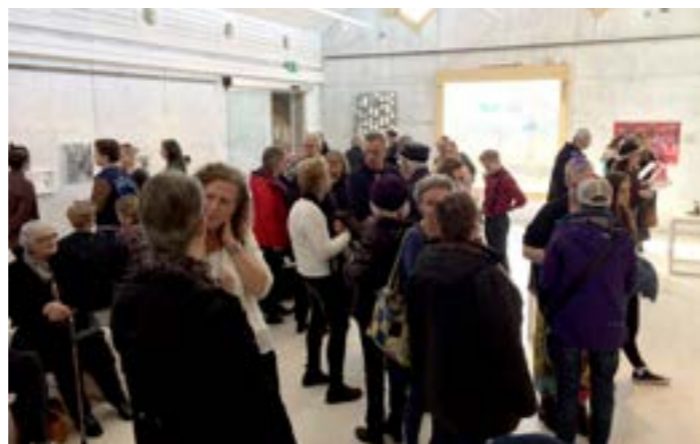
Publiken var talrik vid invigningen av Ungdomens vårsalong.