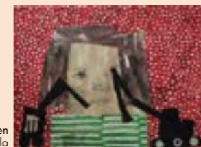
Stillbild ur filmen Arbete under process av Maurits Ylitalo

Black box videovisning: 3 st filmer, 3 – 5 minuter/film.