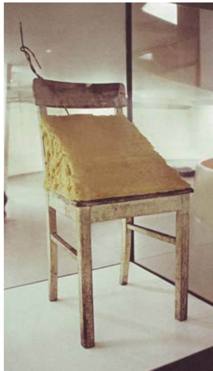
Joseph Beuys, Fettstuhl, 1964. Många verk av Beuys finns idag att avnjuta i Block Beuys, Hessisches Landesmuseum i Darmstadt.