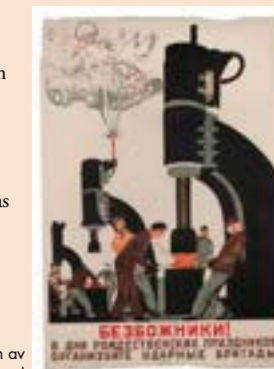
"Bezbozniki!" sovjetisk propagandaffisch av V. Lusjin år 1931.

I sommarens utställning på Eksjö museum visas förutom de sovjetiska affischerna också annat material om resan.