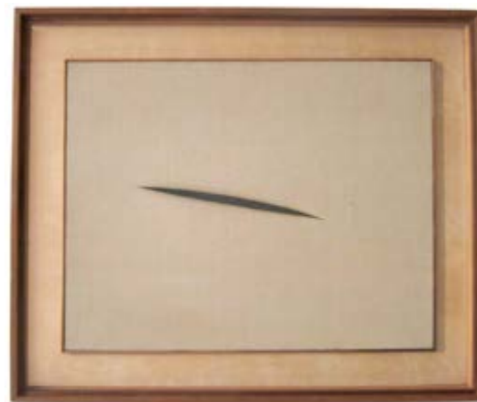
Lucio Fontana, Spatial Concept "Waiting", 1960, Tate Modern.