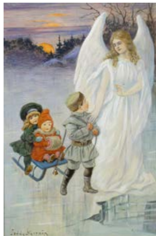
Jenny Nyström, Ängel och isvak. Kvinnliga konstnärer är tyvärr kraftigt underrepresenterade i Jönköpings läns konstförenings samlingar.

Ibland måste man vända perspektivet och se möjligheter. Vad är det som gör att vi faktiskt är närmare 500 medlemmar just nu?