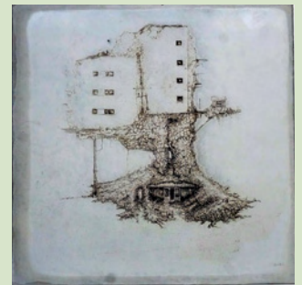
Celldelning Mattias Bäcklin