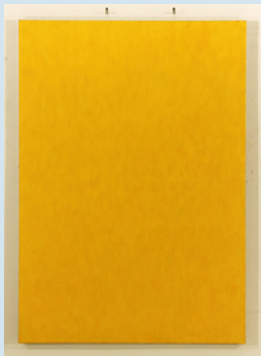
Bee in spring Anders Knutsson

Konstnären arbetar ofta med storskaliga teckningar och bygger upp sina bilder lager för lager med blyerts. Teckningarna präglas av ett stilla meditativt tillstånd där ingenting verkar hända utom vårt eget varande. Hon tycks inspireras av ögonblick i vardagslivet, naturens föränderlighet och dygnets varierande ljushållanden. Aleksandra Kucharska är född 1981 i Gdansk, Polen.