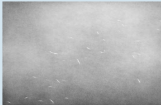
Graphite on paper Aleksandra Kucharska