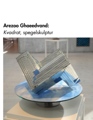
Arezoo Ghaedvand: Kvadrat, spegelskulptur