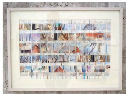
Ulla Hultberg: Vinter i mars, akvarell collage