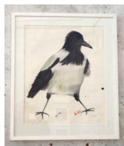
Ann Rydh: Hoppas..., måleri