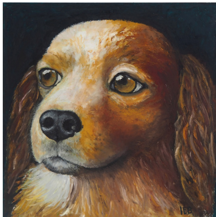
"Hunden Boss" av Ingwör E Björnsdotter. En av bilderna på Länssalongen.

För konstföreningens del har folkhälsomyndighetens råd och regeringens beslut inneburit att vi inte har kunnat genomföra vårt årsmöte som planerat. Det känns därför tillfredsställande att kunna meddela att årsmöte ska hållas