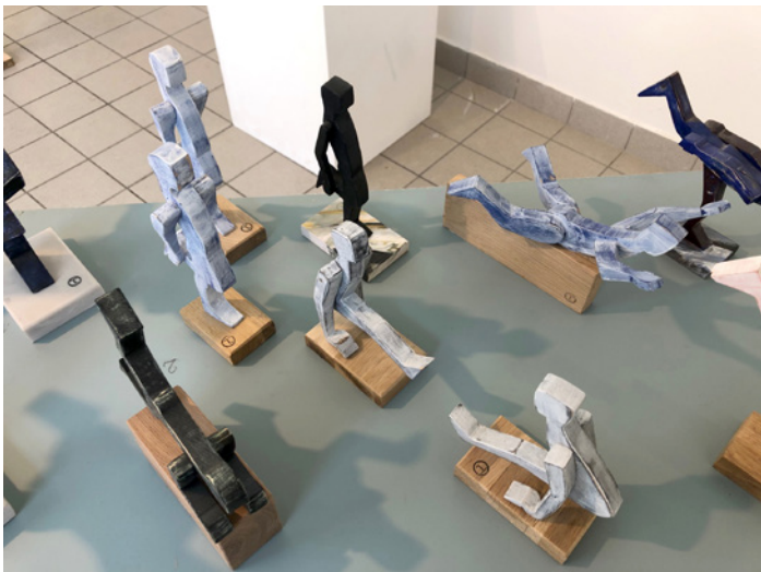
Skulptur av Thorulf Löfstedt på utställningen "Nyfiken lust".

Arbetet med Länsalong 2022 är påbörjat och planeringen är i full gång. Länsalongen kommer att pågå från den 26 mars till den 15 maj. För att delta ska man vara konstnär med koppling till Jönköpings län.