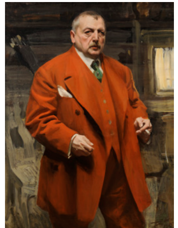
Anders Zorn, Självporträtt i rött, 1915. Olja på duk. Zornmuseet.

För att besöka utställningen behöver biljett förbokas för en särskild dag och tid. Även barn och unga under 20 år samt övriga med fri entré måste ha biljett med förbokad dag och tid. Ordinarie biljettpris är 170 kronor. Det finns också digitala presentationer i teams som man kan delta i. Det är förbokning som gäller och kostnad 50 kronor.