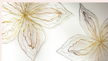
Ulrika Berge - Förundran