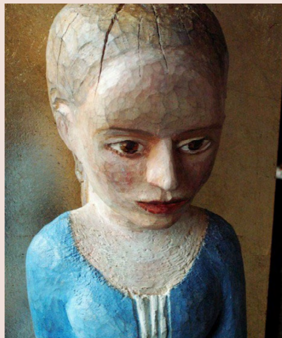
Madonnor och vanligt folk

Madonnan från Edshults gamla kyrka lånas hem från Historiska museet, tillsammans med ytterligare en madonnafigur från Västra Eds kyrka. I utställningen möter de samtida sakral skulptur av Åsa Holmlund. Dessutom folklig skulptur i form av Helge Ruglands porträttliga avbildningar av allmogen i Småland.