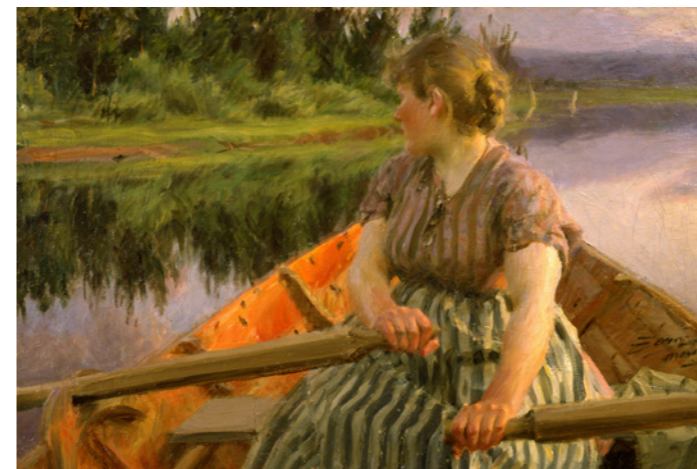
Anders Zorn, Midnatt, 1891. Olja på duk. Zornmuseet.

Under arbetet med utställningen uppstod frågan om det finns någon röd tråd i Zorns samlade produktion? Hans tekniska handlag är förstas en stark gemensam nämnare men de flesta av hans arbeten förmedlar också något som kanske bäst beskrivs som nerven i en viss situation eller som poetiska respektive psykologiska kvaliteter. Det kan vara närvaron eller ansiktsuttrycket hos modellen i ett porträtt. Det kan vara hur en modell fryser på en klippa i