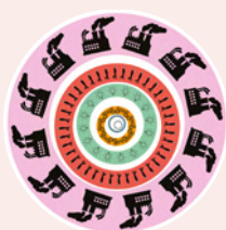
Välkommen till Biosfären