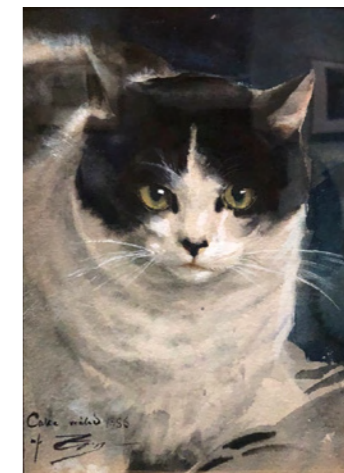
Anders Zorn, Calle katt, 1886. Akvarell.