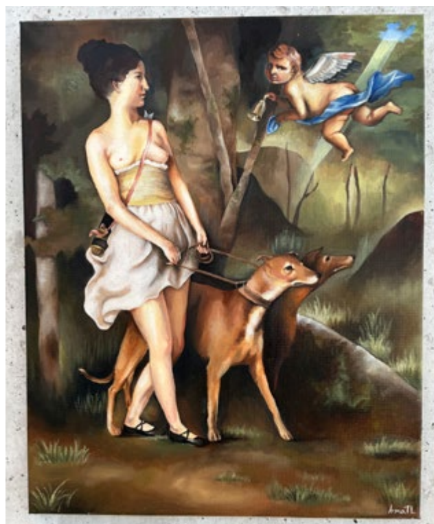
Budbäraren av Irma Tolke Lagerkvist