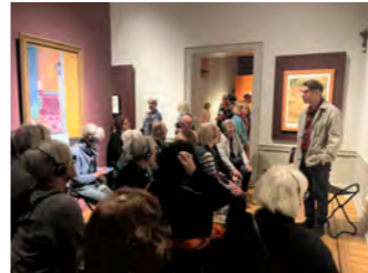
Konstföreningens långresa gick detta år till Nederländerna, men vi hann också med en resa till Stockholm och Nationalmuseum.